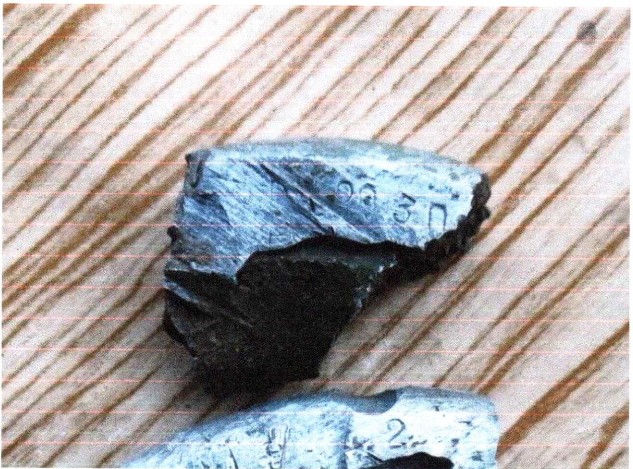
Фото № 6. Фрагмент блока двигателя с частично сохранившимся номером мотора № 293031.