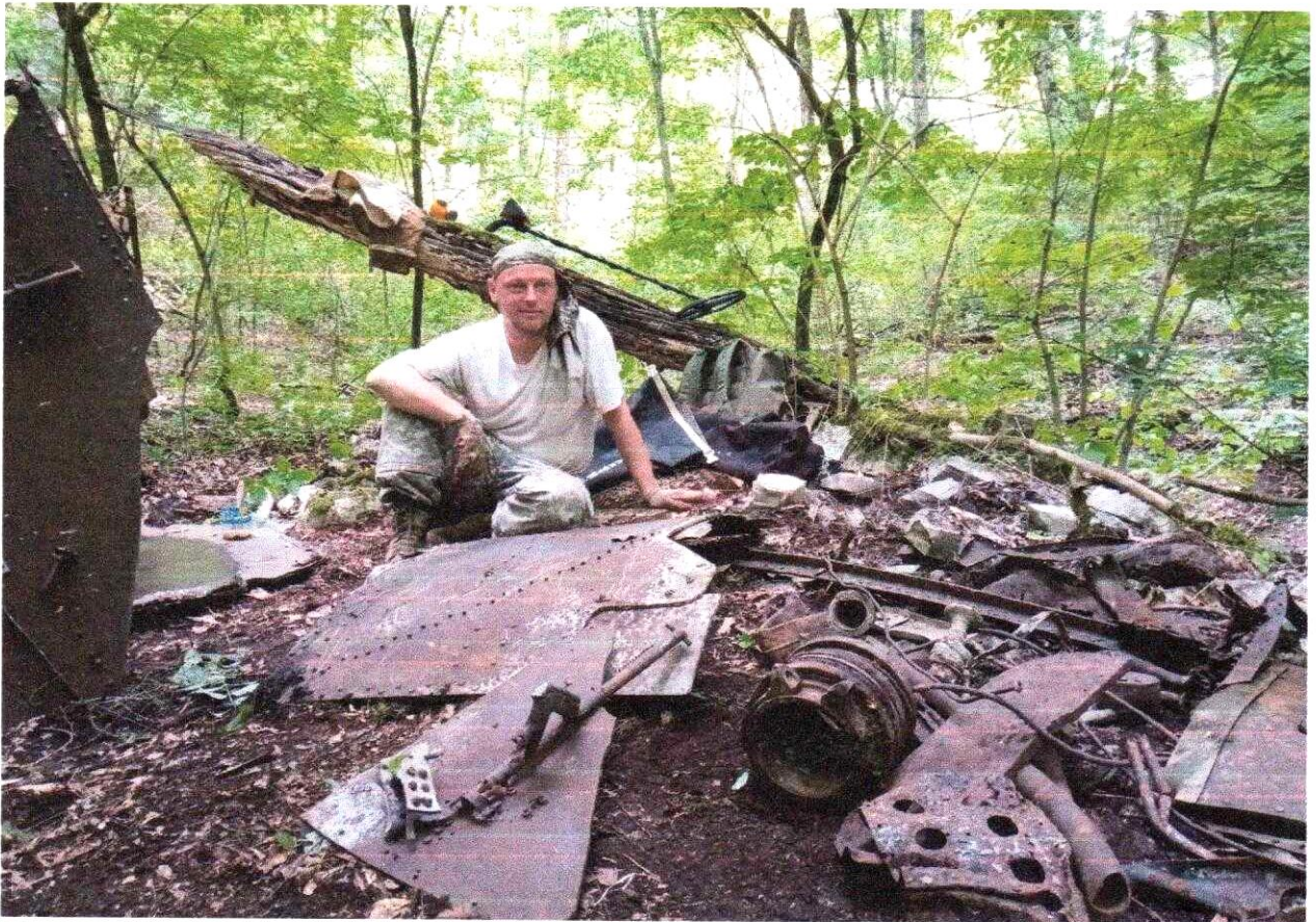
Фото № 2. Обломки самолета на горе Рябкова в Медвежьей щели.