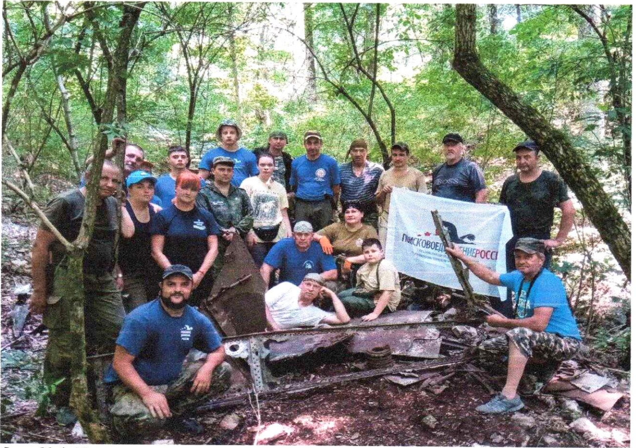
Фото № 1. Участники экспедиции на месте падения самолета Ил-2.