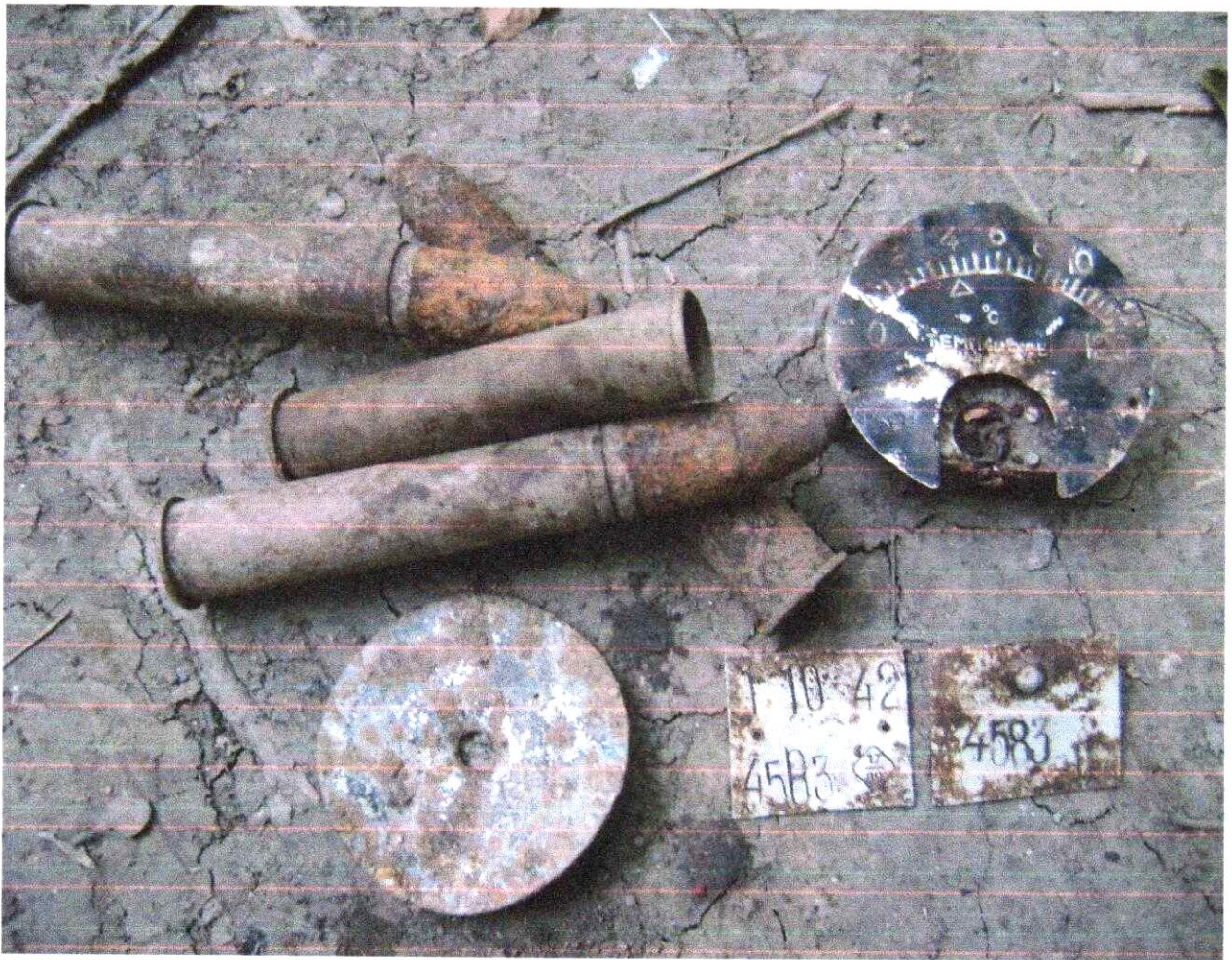
Фото № 3. Технологические таблички, обнаруженные на месте падения.