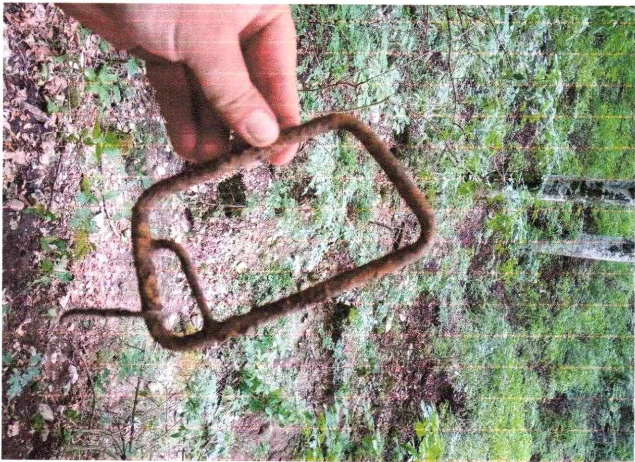
Фото № 7. Вытяжное кольцо парашютной системы пилота.